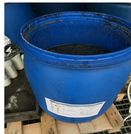
Fût de déchets : poudrette + eaux d'extinction